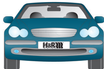
Mit TRAK+™ Spurverbreiterungssystem Spurweite (ET +18) Fitted with TRAK+™ Spacers (offset +18)