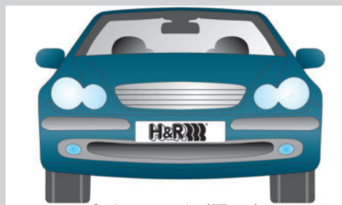
Serienspurweite (ET +43) Original track (offset +43)