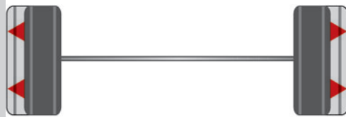
Spurverbreiterungen von 10-90 mm möglich Track increase available from 10-90 mm